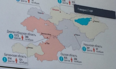
Общее количество чрезвычайных ситуаций в год, за 1990-2020 гг.